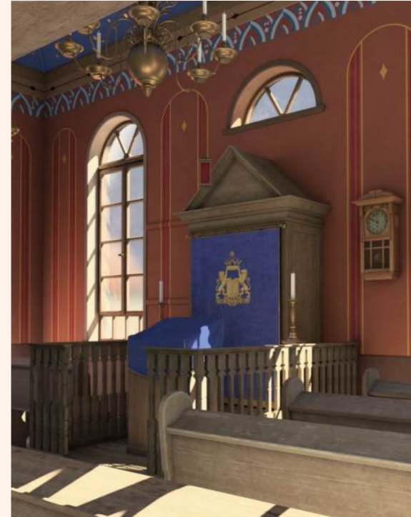
Virtuelle Rekonstruktion der Synagoge in Roth Realisation: www.architectura-virtualis.de Film zur Rekonstruktion: www.youtube.com/@landsynagogeroth5792

einmal monatlich. Bei Interesse fragen sie gerne an.